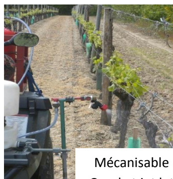
Mécanisable par Quad et jet latéral