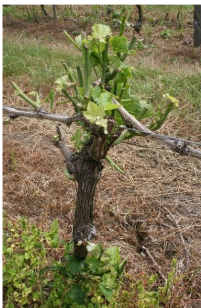
Exemple de pied brouté au printemps

La protection des pieds de vigne se fait par simple pulvérisation du produit sur le végétal , pied à pied ou mécanisable. Attention, ne pas mélanger avec d'autres produits.